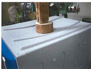
写真 2 天板の静荷重試験 試験中の天板のたわみ