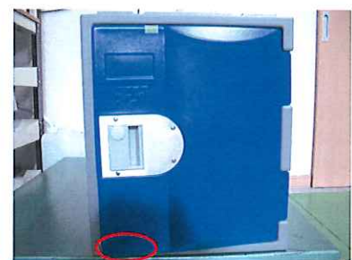
試験 4 開き戸への垂直荷重試験 試験後の扉の傾き 本体に接触する（印部分）