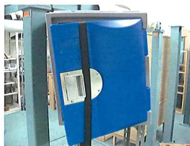
写真 3 開き戸への垂直荷重試験 試験中の扉の傾き