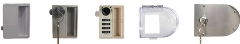
取手(錠無し) シリンダー錠(取手付) ダイヤル錠 錠前保護カバー シリンダー錠