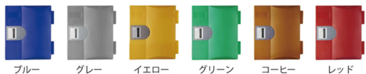
ブルー グレー イエロー グリーン コーヒー レッド